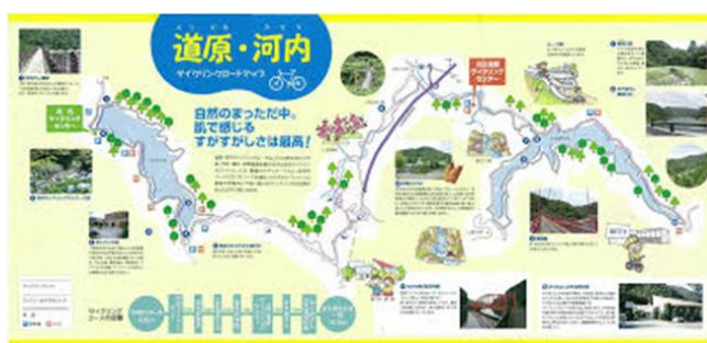
図 道原・河内サイクリングロード