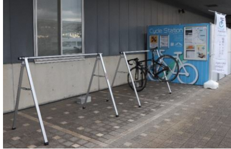
＜北九州空港のサイクルステーション＞

トイレが利用できる施設などに、サイクルスタンドや空気入れなどを設置することで、サイクリストが気軽に休憩できるサイクルステーションを整備します。