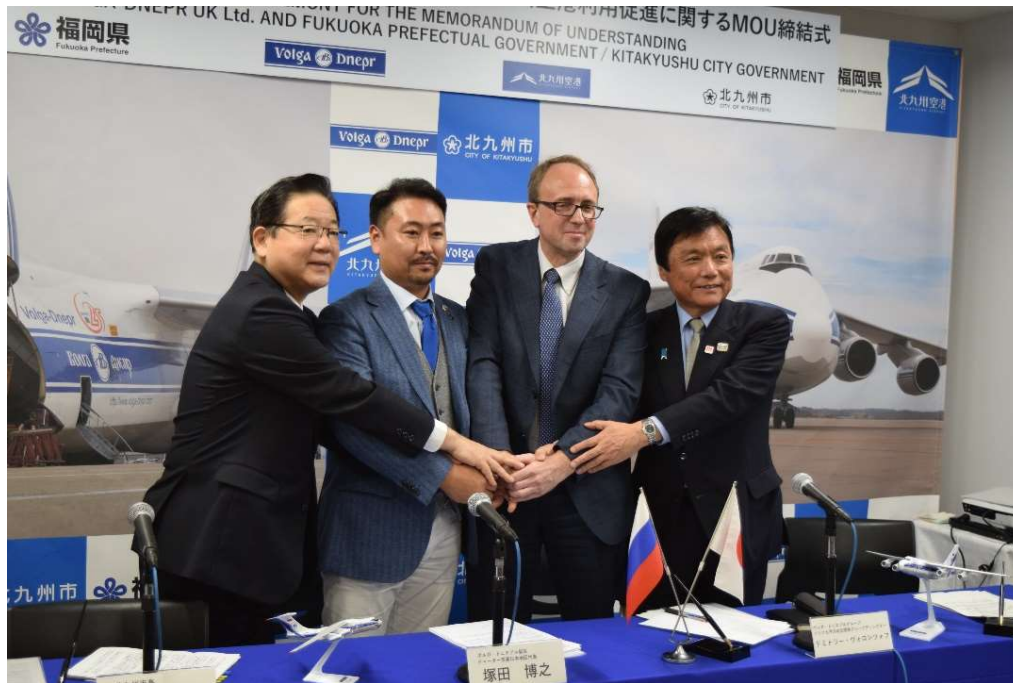
北九州空港利用促進に係るMOU締結式

同社と日本の地方自治体とのMOU締結は、今回が初めてであり、北九州空港の貨物拠点化の推進と空港機能強化に大きな弾みが付くことが期待。