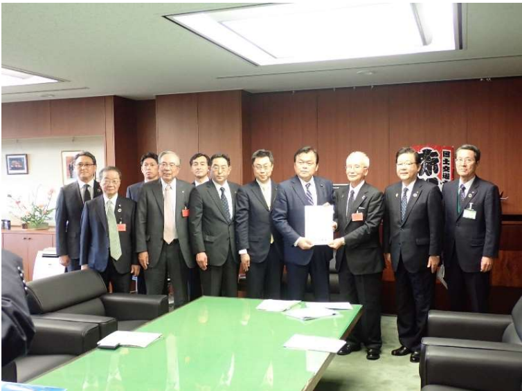
▲赤羽国土交通大臣への要望活動