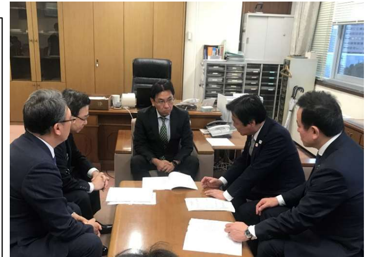
▲航空局長への要望活動