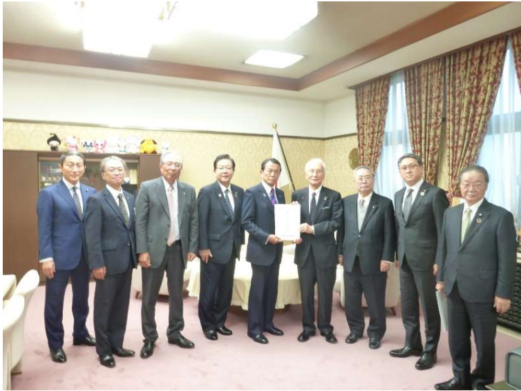
▲麻生財務大臣への要望活動