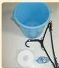
商品そのものや 商品の付属品