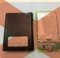
モバイルバッテリー