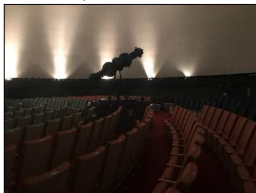
プラネタリウム内部