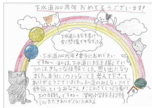
子どもたちからの手紙