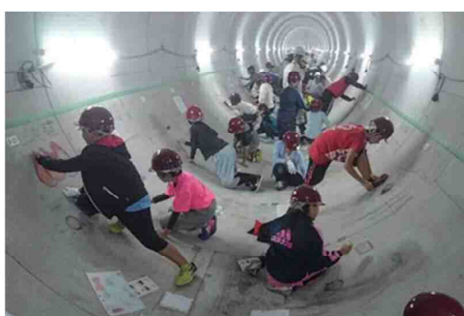
タイムトンネル事業