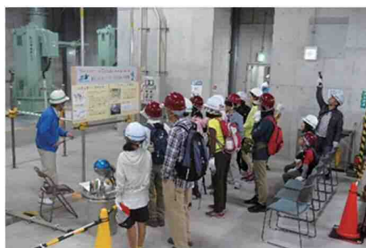
説明の様子（地下2階）