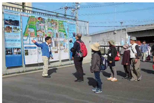
見学会の様子（地上）

「JR九州ウォーキング」とのコラボ企画で、ウォーキングのコース上で下水道施設の見学会を実施。戸畑ポンプ場の地下2階まで降りていただき、ポンプの巨大さや、その役割を見学。