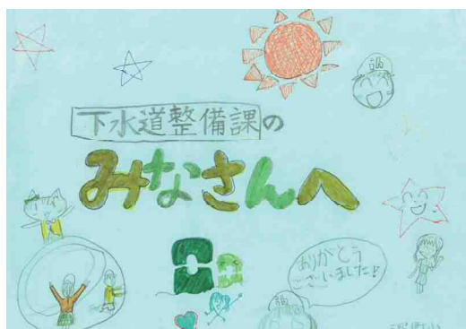
子どもたちからの手紙