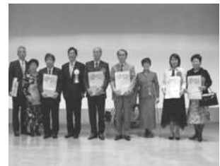
▲第1回北九州市ワーク・ライフ・バランス表彰