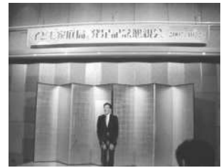
▲子ども家庭局発足