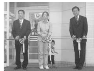
▲赤ちゃんの駅事業開始