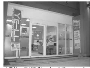
▲子ども・若者応援センター「YELL」オープン