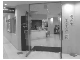
▲ユースステーションオープン