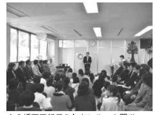
▲八幡西区親子ふれあいルーム開設