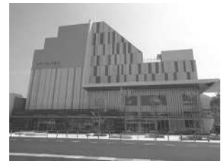
▲スペースLABOオープン