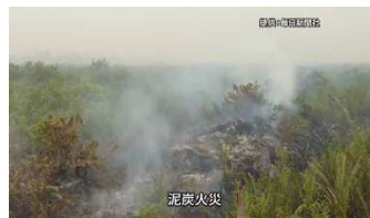
泥炭地火災の紹介