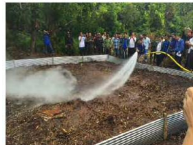
現地での消火実験の様子