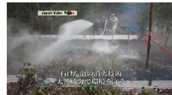
インドネシアにおける泥炭地火災の消火実験を紹介