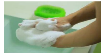
シャボン玉石けんの紹介