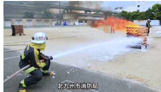
消防局の取り組み紹介