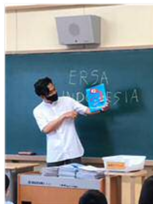
「小学校との交流事業」