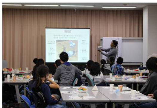
「サイエンスカフェ」