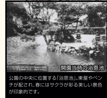
開園当時の浴恩池

公園の中央に位置する「浴恩池」。東屋やベンチが配され、春には桜が彩る美しい景色が印象的です。