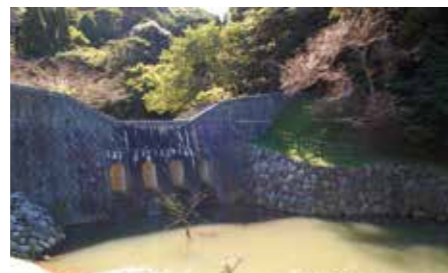
▲ひんやりとした遊歩道を登って行くと、桜が植えられた広場があり、石造りの砂防ダムのそばには小さな池があります。

所在地 / 門司区元清滝1番・4番・5番 開設 / 1916年11月3日 面積 / 3.4ha