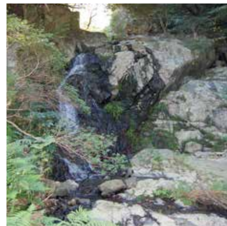
▲風師山へと向かう道路脇の入り口から公園に足を踏み入ると、木々に覆われた遊歩道が、山肌に沿うように上へと続き、右手には小川が所々で小さな滝となり流れ落ちています。