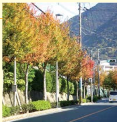
北九州市内に植栽されている樹種の割合

中国南部の原産で、幹はまっすぐ伸び、葉の形は3つに分かれた、いわゆる「カエデ形」をしています。秋には、紅、薄紅、黄色に紅葉します。