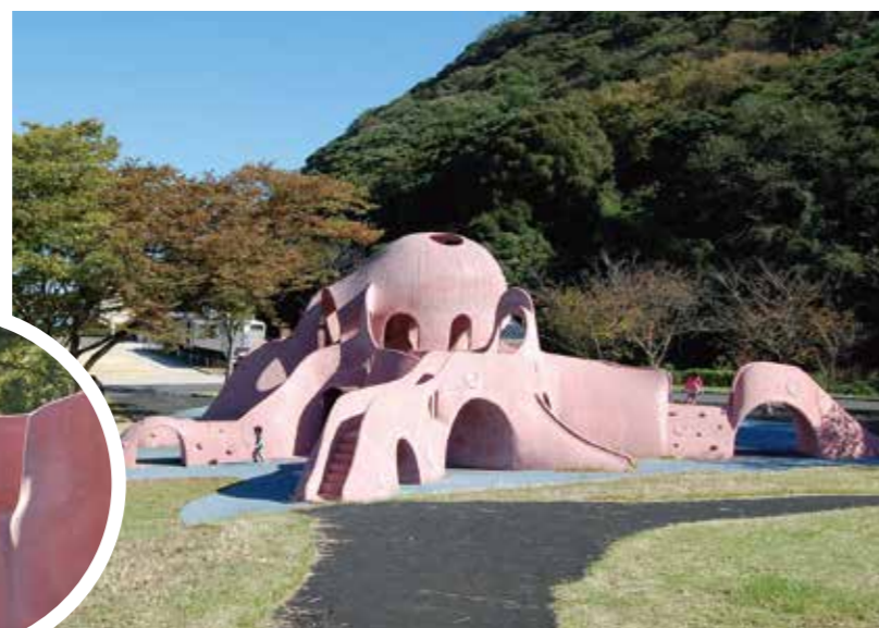
▲名産品の「関門海峡たこ」にちなんで2010年に誕生