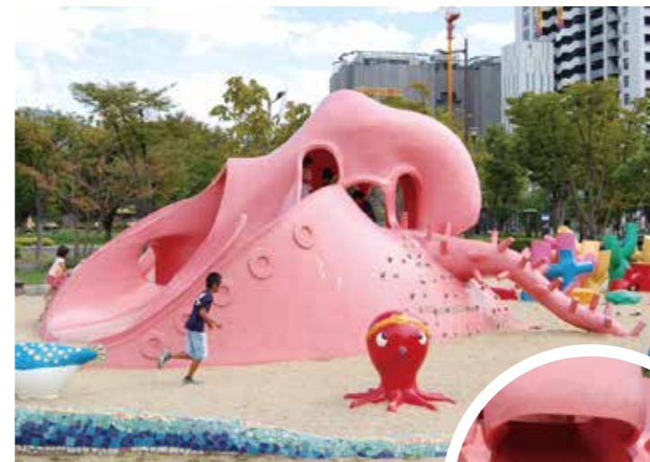
▲巨大な頭がリアルな雰囲気