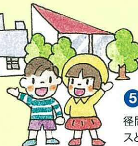
5 めがね橋(南河内橋) 径間(スパン)60mレンティキュラー・トラスという珍しい形式の橋です。赤く塗られた独特の形をしており、通称「魚形橋」と呼ばれ、池に美観をそえて河内の名物になっています。