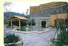
3 あじさいの湯 八幡東区河内地域で湧出した天然温泉と周辺の水辺や緑を活かした多世代の市民が楽しく憩える温泉施設です。内風呂、打たせ湯、露天風呂、洞窟風呂、サウナなどを完備。サイクリングの途中にお気軽にお立ち寄りください。