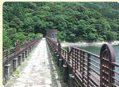
1 河内ダム堰堤 1927年完成の河内ダムの堰堤は、ヨーロッパの古城を思わせるおしゃれな造り。大正～昭和のモダニズムが漂います。