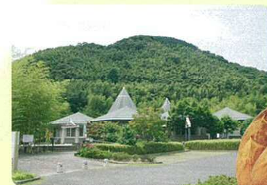
6 合馬たけのこ 北九州市の竹林面積は約1,500ヘクタールにわたり、市町村単位では全国有数の広さを誇ります。この豊かな竹林資源から美味しいたけのこが生産されています。中でも特に「合馬たけのこ」は、関西市場でも最も単価の高い極上品として取引されています。4月頃を中心に、合馬地区の観光農園でたけのこ掘りが楽しめます。