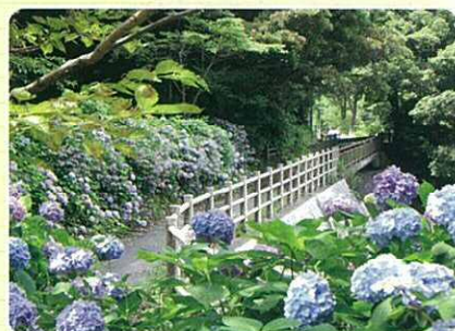
2 河内サイクリングセンター付近