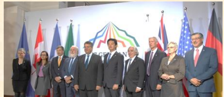
前回の大臣会合（於：ドイツ・ハンブルク）