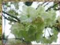
御金桜(ゴウゴンザクラ)

北九州市立白野江植物公園 〒801-0802 北九州市門司区白野江2丁目 ☎093(341)8111