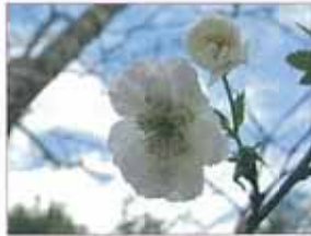
十月桜(ジュウガツザクラ)

北九州市立白野江植物公園 〒801-0802 北九州市門司区白野江2丁目 ☎093(341)8111