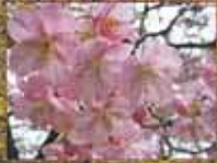
河津桜(カワツサクラ)