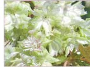
御衣黄桜(ギョウイコウザクラ)

黄緑色の花弁が美しい「御衣黄」の太木や、清楚な香りのする「駿河台匂」、4月中下旬から咲き始める「普賢象」、10月から開花する「十月桜」など様々な桜を長期間楽しめます。