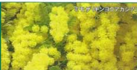
ミモザ(キンヨビアカンア)