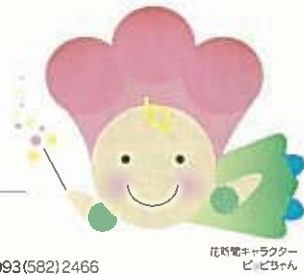
花新聞キャラクター ピピちゃん

北九州市建設局 公園緑地部緑政課花係 〒803-8501 小倉北区城内1-1 ☎093(582)2466