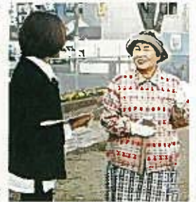
ださったり、その度にありがたい気持ちでいっぱいです」と感謝の言葉が続きます。その時、通りすがりの人がふらりと花壇の前のベンチにこしかけました。皆が一瞬笑顔になって「花を眺める姿をみかけたり、きれいな」という言葉を聞くと本当にうれし「という声がとびだしました。そんな皆さんの21世紀の希望は「自分達が住む街を、さらに花でいっぱいにしてほしい」そのために、もっとたくさんの人に花づくりに参加してほしい」ということです。