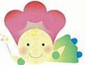
花新聞キャラクター ピッピちゃん

北九州市建設局 公園緑地部緑政課花係 〒803-8501 小倉北区内1-1 ☎093(582)2466