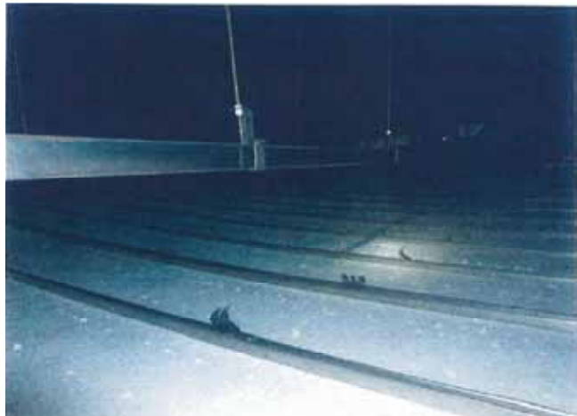
図 1 - 4 脱落部分以外の天井内クリップ外れ状況 2