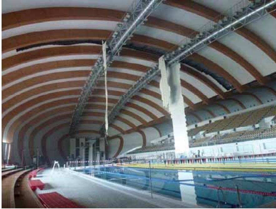
図 1 - 1 天井脱落状況