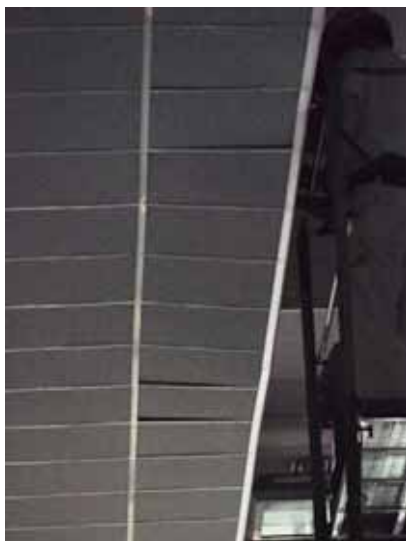
図 2 - 3 脱落箇所下部天井面ゆがみ