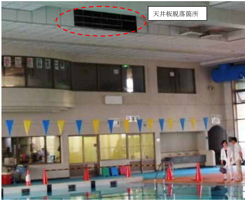
図 2 - 1 天井立ち上がり部脱落状況