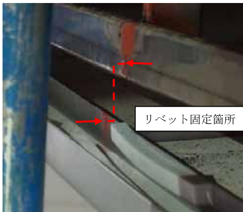
図 2 - 2 骨組み留め付けリベット抜け状況