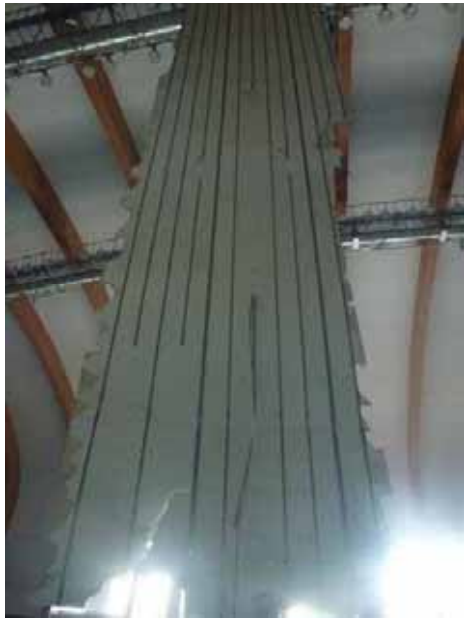
図 1 - 2 脱落した天井材