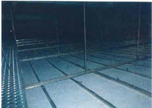
図 1 - 3 脱落部分以外の天井内クリップ外れ状況 1