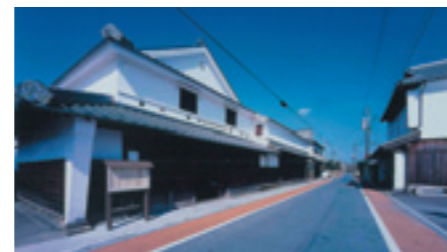
八幡西区木屋瀬地区

本市には、門司港レトロ地区や木屋瀬の宿場町など、歴史を感じられる街並みや、西日本工業倶楽部（旧松本家住宅）や旧古河鋳業若松ビルなど、歴史的建造物が数多く残っています。これらは、私たちのふるさと意識を育み、魅力あるまちづくりの基盤となるため、文化財の保存や観光拠点の整備との取組と連携し、歴史的な街並みや建造物の保全を進めています。八幡西区木屋瀬地区においては、平成10年から、一定要件を満たした建造物等に対して、修理・修景の一部を助成し、平成21年度までに修理20件、修景20件、計40件の整備を行いました。