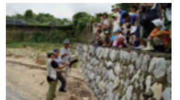
▲カブトガニの説明を聞く参加者

市民が希少な野生生物や豊かな自然環境とふれあう機会をつくるため、エコツアー(自然環境講座)を平成14年度から開催しています。平成21年度は、里山やカブトガニをテーマに市民団体の協力を得て行った環境局主催事業や、NPO主催の事業も開催されました。