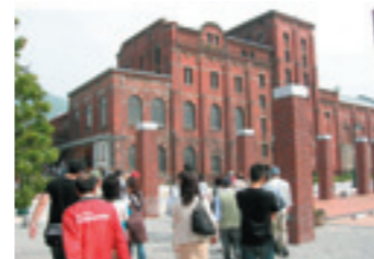
門司赤煉瓦ブレイス：門司駅北側地区

景観は、人と自然の営みから形づくられたものであり、北九州の歴史や文化、経済活動など、まちの姿そのものを表しています。したがって、景観づくりは、まちづくりの根幹となる大切な取組であり、市民・事業者・行政が協働して取り組んでいくことが必要です。本市では、「北九州市景観づくりマスタープラン」を策定し、市民のみなさんが北九州の景観を知り、地域主体の景観形成の取組が進むよう積極的に支援するとともに、景観意識の向上や担い手育成に取り組み、市民の主体的な景観づくりを推進しています。