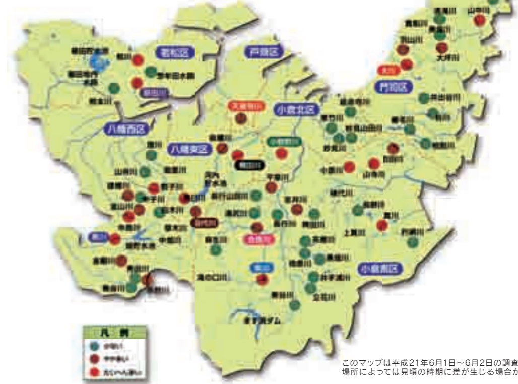
このマップは平成21年6月1日～6月2日の調査に基づいたものです。場所によっては見頃の時期に差が生じる場合があります。