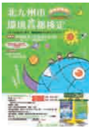
平成21年度 募集広告