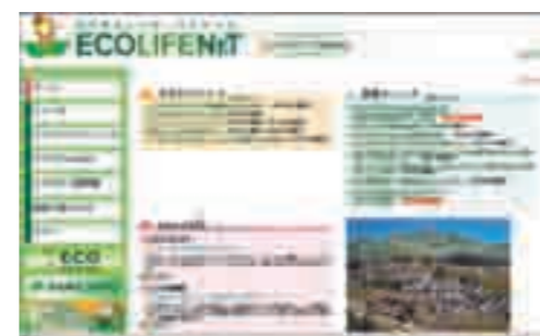
エコライフネットのトップページ http://www.ecolife-net.jp/

北九州エコライフステージ、北九州エコタウン、環境ミュージアム、北九州市エコライフプラザ等の各HP