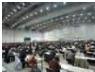
検定実施会場の様子