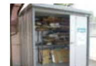
古紙回収用保管庫