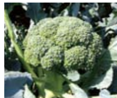
ブロッコリー 【若松区】