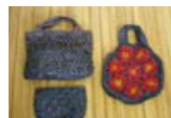
カセットテープ等を使ったマイバッグ