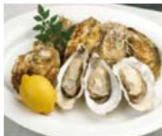
豊前海一粒かき 【門司区、小倉南区(豊前海)】