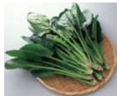
ほうれんそう 【小倉南区】