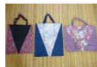
傘布を使ったマイバッグ

中島校区は環境への意識が高く、当市民センターに設置している古紙、小物金属、トレイ、空き缶、牛乳パック、廃食油の回収ボックスもよくご利用いただいています。この校区は高齢者が多く、環境というより「もったいない」という意識が強いようですが、この意識が将来に大きな影響を与えていると思います。中島小学校は生徒数が少なく単独で運動会が開けません。そのため地域と合同で運動会や文化祭を行っており、そこで中島校区まちづくり協議会の集団資源回収団体奨励金が有効に活用されています。中島校区は、みなさんと一緒に体を動かし、環境啓発もできるともよいコミュニティーです。