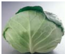
キャベツ 【若松区、小倉南区】