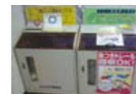
資源物の回収ボックス