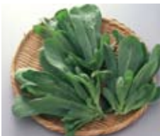
大葉春菊 【小倉南区】