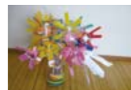
ペットボトルのかざぐるま