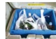
廃食油の回収状況