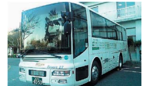
北九州市エコツアー第 1 陣「そらべあ号」が来訪（H19.11.17）

旅程中、関西地区及び九州地区で BDF を給油。九州地区では、北九州エコタウンで給油しました。そのほか、エコタウンセンターや風力発電を見学しました。