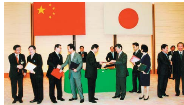
首相官邸における覚書の交換（平成 20 年 5 月）

北九州市は、エコタウン事業の経験を活かしてこれらの事業に参画することにより、中国における循環型社会の構築に貢献するほか、世界の環境首都としてのブランドイメージ向上も図りたいと考えています。また、協力事業と並行して環境関連企業によるビジネス交流を促進することにより、将来的には市内企業のビジネスチャンス拡大につながることも期待されています。