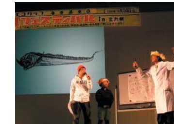
3 月 30 日 (日) ステージイベント さかなクン トークショー