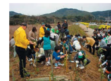
3 月 29 日 (土) エコツアー植樹体験