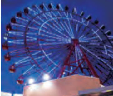
▲チャチャタウン小倉のブルーライトアップ

世界自閉症啓発デーイベント 観覧車のブルーライトアップ点灯式や消防音楽隊の演奏とカラーガード隊による演技など。4月6日(土)18～19時10分、チャチャタウン小倉(小倉北区砂津三丁目)で。小倉城(小倉北区)でもブルーライトアップ(19～23時)あり。小雨決行。 ☑ 発達障害者支援センターつばさ ☎922・5523へ。