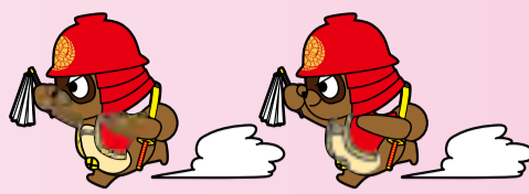
八幡西区マスコットキャラクター官兵衛タン