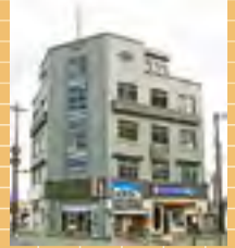
「シリーズ日本遺産 関門ビル(山口県下関市)」