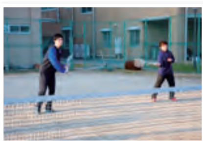
▲互いが互いの期待に応え、高め合える関係だ

課題だったのは練習時間の確保。高校の部活動は16時30分からの1時間だけ。そこで、互いの連携強化と苦手克服のための練習に集中した。さらに、個別に社会人チームに所属して腕を磨いた。