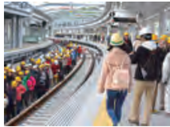
▲平成28年12月に開通された折尾駅鹿島本線高架トンネルウォーク

3月に供用を開始する折尾駅の筑豊本線高架橋など全長約2kmのコースを歩きます。2月24日(日)8時30分(参加受け付けは8時30分～14時)に折尾駅北口をスタートし、15時までに折尾愛真学園(八幡西区堀川町)にゴール。小雨決行。☎折尾駅☎691・0024へ。☎建築都市局折尾総合整備事務所☎602・3108。