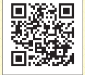
Kitakyu Movie Channel QRコード

各番組は放送後に、北九州市公式YouTubeチャンネル「Kitakyu Movie Channel」で配信します。