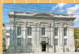
シリーズ日本遺産「山口銀行旧本店(山口県下関市)」