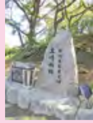
福岡県指定史跡 黒崎城跡

編集 八幡西区役所総務企画課 ☎642・1441(代表) FAX 621・0862