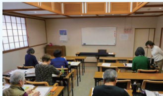
茶道、香道、書道などの文化講座