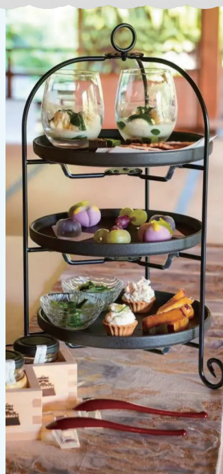
書院棟で楽しむアフタヌーンティー体験(不定期開催)