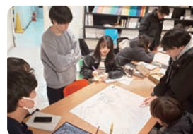
▲市長提案に向けて学生たちが準備する様子