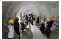
▲雨水貯留管の見学会

近年、記録的な豪雨が全国で頻発しており、北九州市でも大きな浸水被害が発生しています。市では、災害に強く、安らぐまちの実現を図るため、雨水を海や川に排出する「雨水管」や「雨水ポンプ場」、大量の雨を一時的にためる「雨水調整池」や「雨水貯留管」などを整備しています。