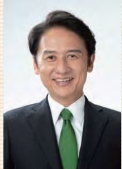
北九州市長 武内 和久

これから時代が変化する中、水道管の老朽化や地震対策などのための技術や費用も必要となりますが、これらの課題にしっかり取り組み、大切な「水」を未来へ引き継いでいくため、市民皆さんで知恵を出し合い、力を合わせていきましょう。