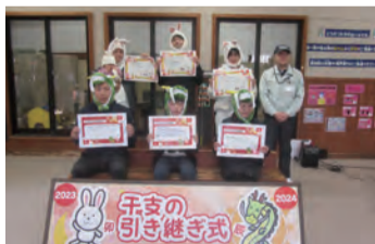
▲昨年の参加者の皆さん

タツ年の代表からへび年の代表に干支を引き継ぎます。12月29日(日)12～12時30分、到津の森公園(小倉北区上到津四丁目、☎651・1895)で。料入園料が必要。