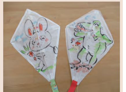
共通甲電話で12月17日から同施設へ。

冬の工作教室 絵を描いて、たこを作ります。たこあげもあり。1月26日(日)10~12時。対小学生(3年生以下は保護者同伴)。定先着10人。料700円。