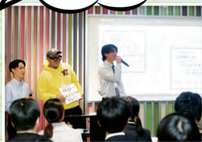
▲小倉・折尾合同ピッチ大会

「チャレンジを通して一步踏み出したい」、「具体的なアイデアをみんなで考えたい」、そんなZ世代の若者を対象としたプログラムです。15～29歳の63人が自分自身や北九州市の課題を解決するためのスキルを学び、参加者でチームを作ってワークショップをしながら、北九州市を盛り上げる事業を企画・実践しています。