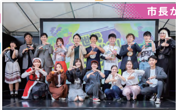
▲コンテスト後の集合写真