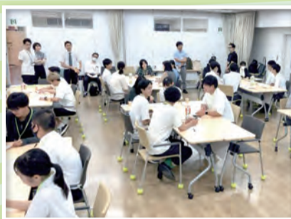
▲折尾でのワークショップの様子

「チャレンジを通して一步踏み出したい」、「具体的なアイデアをみんなで考えたい」、そんなZ世代の若者を対象としたプログラムです。15～29歳の63人が自分自身や北九州市の課題を解決するためのスキルを学び、参加者でチームを作ってワークショップをしながら、北九州市を盛り上げる事業を企画・実践しています。