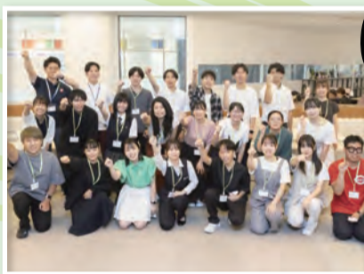
▲小倉でのワークショップメンバー