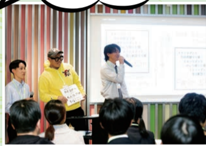
▲小倉・折尾合同ピッチ大会

「チャレンジを通して一步踏み出したい」、「具体的なアイデアをみんなで考えたい」、そんなZ世代の若者を対象としたプログラムです。15～29歳の63人が自分自身や北九州市の課題を解決するためのスキルを学び、参加者でチームを作ってワークショップをしながら、北九州市を盛り上げる事業を企画・実践しています。