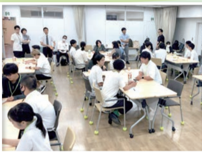
▲折尾でのワークショップの様子

「チャレンジを通して一步踏み出したい」、「具体的なアイデアをみんなで考えたい」、そんなZ世代の若者を対象としたプログラムです。15～29歳の63人が自分自身や北九州市の課題を解決するためのスキルを学び、参加者でチームを作ってワークショップをしながら、北九州市を盛り上げる事業を企画・実践しています。