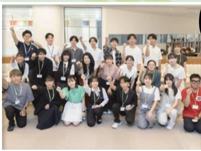
▲小倉でのワークショップメンバー