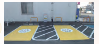
▲ゆめmart永犬丸(八幡西区八枝一丁目)

若いこどもがいる家庭や妊娠している人が優先して使用できる駐車スペースが商業施設に開設されました。