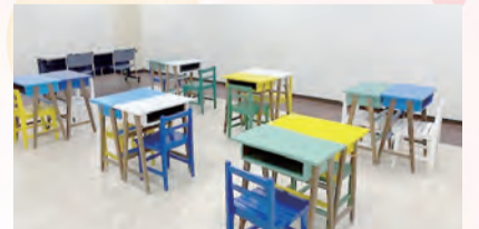
▲ゆめmart門司(門司区柳町二丁目)