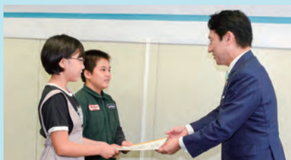
▲市長への提言の様子