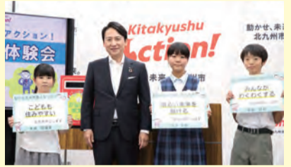
▲こども市長体験会(8月21日)にて