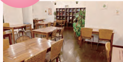
▲AIMビル2階 休憩スペース(小倉駅北側)

市内の商業施設に、小倉高校と敬愛高校の生徒が企画した、こどもが自由に過ごせるスペースを開設しました。