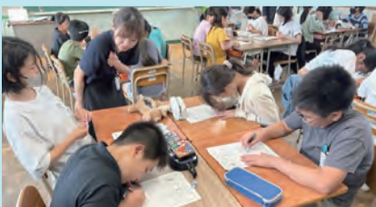
▲ワークショップの様子

市では、受けた提言を基に、「コンタクトレンズ空ケースのリサイクル」や「大池公園(八幡西区)への看板設置」などを早速実現していきます。