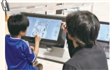
▲デジタル作画の参加者