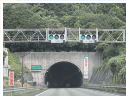
▲金剛山トンネル入口

高速道路なのに信号機がある場所を知っていますか? 小倉南インターチェンジと八幡インターチェンジの間には、約3.6kmの「福智山トンネル」、約2.2kmの「金剛山トンネル」という、長〜いトンネルが二つあります。この二つのトンネルの入口に信号機が設置されています。この信号機は、長〜いトンネルの中で、事故や火災が起きた際に非常事態を知らせる役割があります。