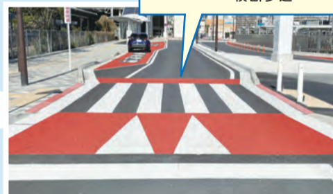
▲下曽根駅北口駅前広場