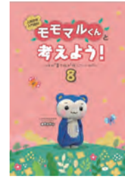
▲「モモマルくんと考えよう!」最新号

人権に関するDVD(400本以上を所蔵)、図書などの貸し出し、ライブラリー内での閲覧・視聴ができます。