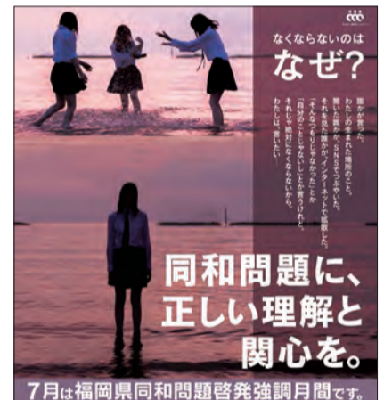
▲令和6年度啓発ポスター

市では、同和問題(部落差別)の解決に向けて、さまざまな啓発事業を行っています。こうした事業への参加を通じて、市民一人一人が人権尊重の精神を正しく身に付け、人権を尊重する行動を日常生活の中で自然に現すことができる社会を、市民みんなで築いていきましょう。