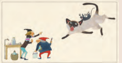
▲「ふしぎなり」『はじめてであうすうがくの絵本1』より 1982年

安野先生のふしぎな学校 画家・安野光雅さん(故人)の作品を展示。7月6日(土)～8月25日(日)。料一般1300円、高校・大学生800円、小・中学生600円。前売り券など詳細は問を。