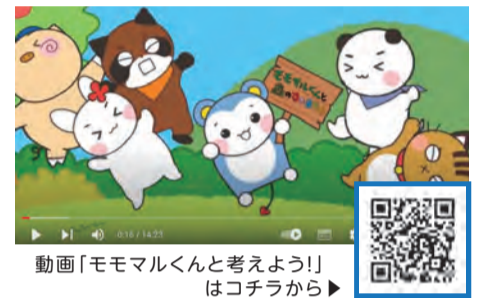
動画「モモマルくんと考えよう!」はコチラから▶

人権問題をモモマルくんと一緒に考える動画を制作しています。地域交流センターなどでDVDの貸し出しができるほか、人権推進センターのYouTubeチャンネルでも視聴できます。