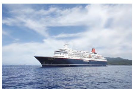
ネット はコチラからも

8月13日(火)15〜16時、下関港第2突堤(下関市東大和町二丁目)で。定20人。往復はがき(2人までに)基本事項を書いて7月16日までにサンデン広告(〒750-