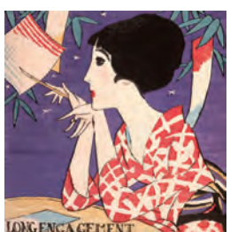
▲[婦人グラフ]大正15年7月号表紙(七夕)