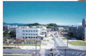
▲北九州市ロボット・DX推進センター