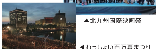
▲北九州国際映画祭