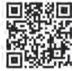
▲河内藤園ホームページ