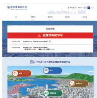
▲「防災情報北九州」画面イメージ