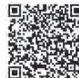
▲ダウンロードはコチラから