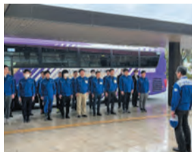
▲被害認定調査の出発式