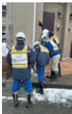
▲被害認定調査の様子