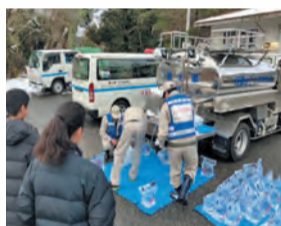
▲応急給水活動の様子