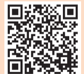
▲市ホームページ(保護司について)