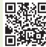
▲自治会・町内会情報ポータルサイト