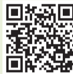
▲戸畑区自治総連合会ホームページ

他にも地域ごとにさまざまな取り組みが行われています。取り組みの詳細な内容は戸畑区自治総連合会ホームページをご参照ください。また、自治会への参加を希望される人は「北九州市自治会・町内会情報ポータルサイト」をご参照ください。自治会に関する相談は問 戸畑区役所コミュニティ支援課☎871・2335まで。