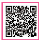
▲市の歯科健(検)診についてはコチラ