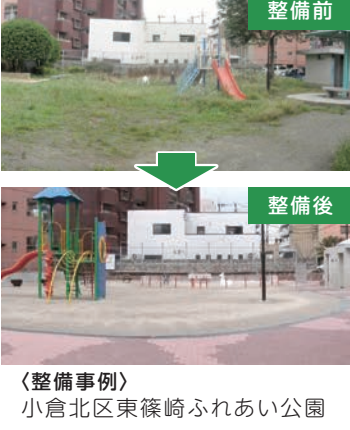
〈整備事例〉小倉北区東篠崎ふれあい公園