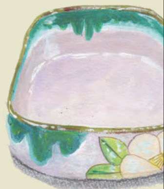
イラスト:はしもとえつよ(絵本作家:北九州市小倉南区在住)