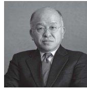
あさだ じろう 浅田次郎

東京都出身。1997年「鉄道員」で直木賞受賞。多彩な作風で読者を魅了し、文学賞受賞多数。