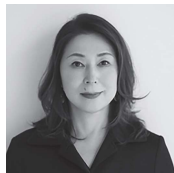
きりの なつお 桐野夏生

石川県出身。1999年「柔らかな頬」で直木賞受賞。ほか文学賞受賞多数。日本ペンクラブ会長。