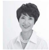
なかい きえ 中井貴恵

群馬県出身。1970年二代目神田山陽に入門。三代目神田松鯉襲名。人間国宝。旭日小綬章受章。