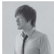
ひらの けいいちろう 平野啓一郎

北九州市出身。1987年「鋼の中」で芥川賞受賞。ほか文学賞受賞多数。日本芸術院会員。