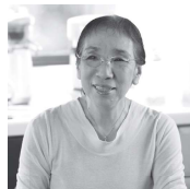
むら たきよこ 村田喜代子

石川県出身。1999年「柔らかな頬」で直木賞受賞。ほか文学賞受賞多数。日本ペンクラブ会長。