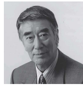
なかむら あつお 中村敦夫

脚本・演出：中村敦夫 (俳優・作家) 出演：神田松鯉 (講談師) 中井貴恵 (女優)