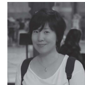
きむ ふな きむ ふな

中国河南省出身。1991年来日留学。城西国際大学客員教授。詩集「石の記憶」でH氏賞受賞ほか。