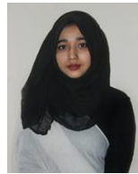
◀ ニスハット・タスリン・モハナ氏 (ハンガラディシュ) (第31期 KFAW海外通信員)

児童労働ネットワーク代表、ジェンダー問題、仕事・労働問題などを専門とし、国連事務局(社会問題担当官)、国際労働機関(ILO)事務局長補、内閣総理大臣官房参事官兼内閣審議官、国連日本政府代表部公使などを歴任。