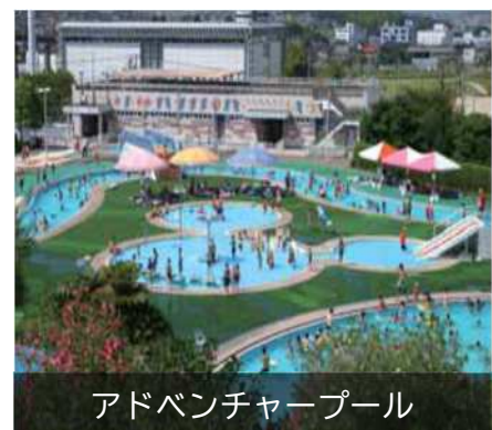
アドベンチャープール