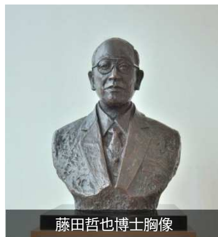
藤田哲也博士胸像