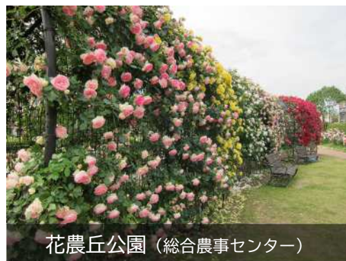
花農丘公園（総合農事センター）

さらに毎年11月には、北九州市を代表する海の幸、山の幸に加え、鹿児島県南九州市や、岩手県釜石市の特産品が大集合する「農林水産まつり」が開催されます。