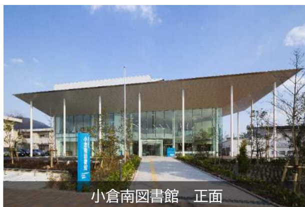
小倉南図書館 正面