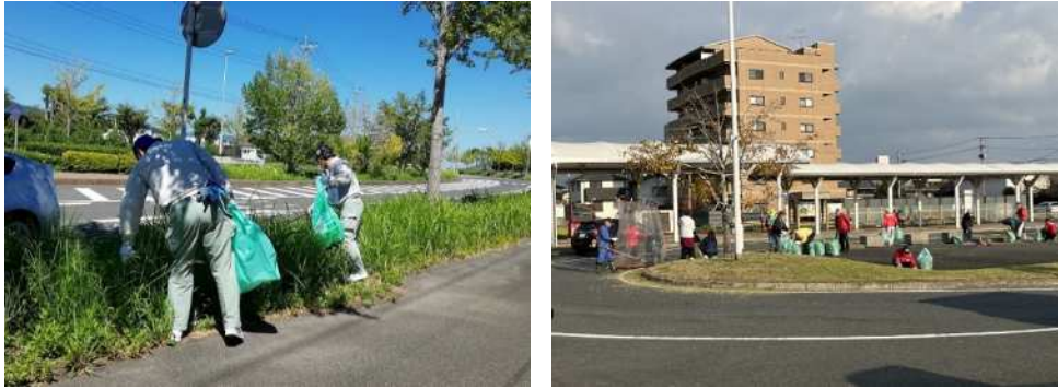
クリーンアップ一斉清掃