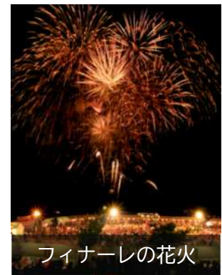
フィナーレの花火

問い合わせ：小倉南区役所 コミュニティ支援課 イベント係 TEL：951-1037