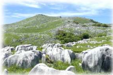
◀白い石灰岩が羊の群れ のよう【羊群原】

この貴重なフィールドをむやみに踏み荒らすことは、平尾台に生息する動植物に悪影響を与えます。平尾台で暮らす人々をはじめ、登山やハイキングを楽しむ人など多くの人と自然を共有していることを十分意識し、この貴重な自然環境を次の世代に引き継いでいけるよう競技中はマナーを守りましょう。