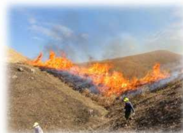
◀毎年春先に行われる 平尾台の野焼き