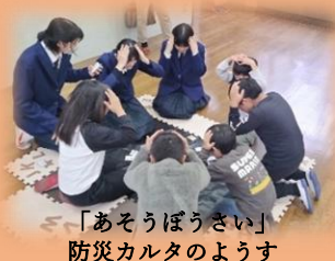
「あそうぼうさい」 防災カルタのようす

※ ご取材いただける場合は、駐車場等の調整のため、11月27日（木）までに下記担当へ連絡ください。