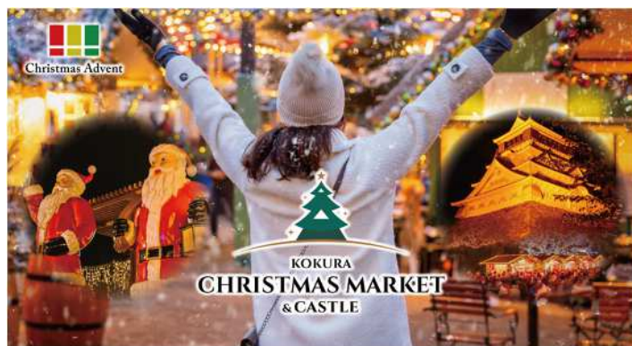
和の象徴・小倉城と洋のクリスマスが融合した 2025年限定マグカップ

お仕事帰りやお買い物の途中にも立ち寄りやすいアクセスの良さも魅力です。イルミネーションの灯りに包まれながら、小倉で過ごすあたたかな冬のひとときを、ぜひお楽しみください。