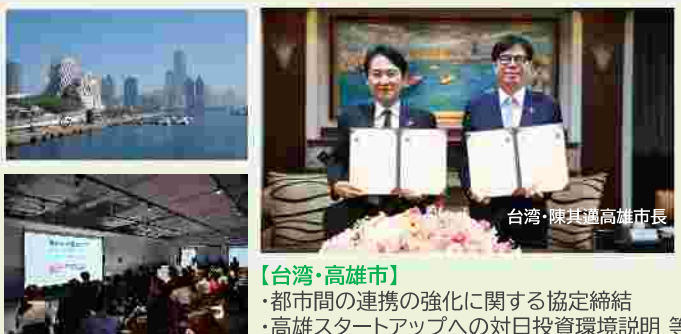
【台湾・高雄市】 ・都市間の連携の強化に関する協定締結 ・高雄スタートアップへの対日投資環境説明 等