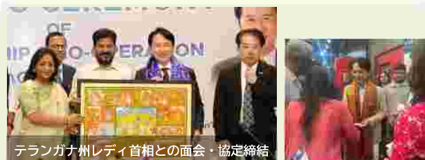
テランガナ州レディ首相との面会・協定締結 【インド・テランガナ州】 友好協力協定の締結・トップセールス