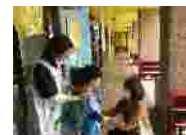
シン・子育てファミリー・サポート事業