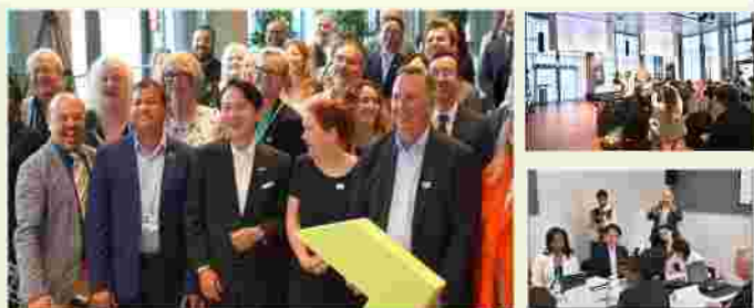
【ドイツ・ボン】 気候変動に関する国際会議への出席