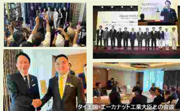
【タイ・バンコク】 ・タイ王国及びASEANからの対北九州市投資の呼込 ・インバウンド等の獲得に向けたプロモーションの展開